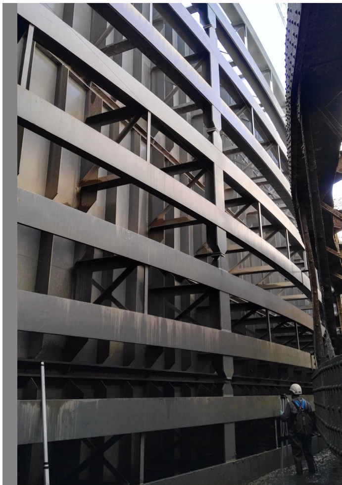
Clapet de régulation de prise d'eau de 10 m de long et 5 m de haut pour une centrale hydroélectrique de la Régie de Gaz et d'Électricité de Bonneville